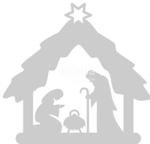
Narodził się Jezus Chrystus...bądźmy weseli....